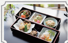
風待ち 夏のアフタヌーンティー 1名様分