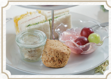
英国式 アフタヌーンティー