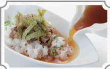
紅茶に恋する アフタヌーンティー 2名様分