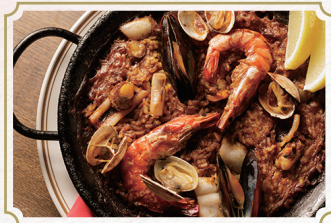
華やぐ スパニッシュ・ナイトティー