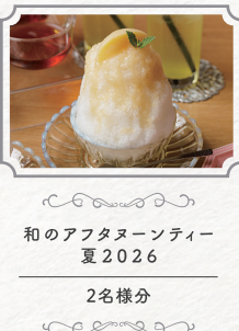
和のアフタヌーンティー 夏2026 2名様分