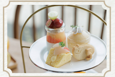
マルゴとF.B.Lの アフタヌーンティー