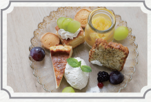
シャインマスカットの アフタヌーンコース