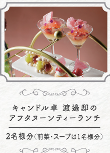
キャンドル卓 渡邊邸の アフタヌーンティーランチ 2名様分(前菜・スープは1名様分)