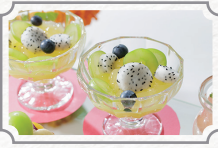
PEPE×EYOHAKU アフタヌーンティー