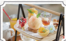
玉島産フルーツの アフタヌーンティー2026 2名様分