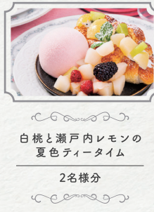
白桃と瀬戸内レモンの 夏色ティータイム 2名様分