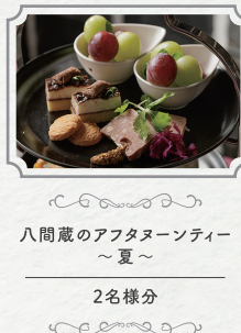
八間蔵のアフタヌーンティー ~夏~ 2名様分