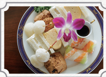
シーサイド アフタヌーンティー 2名様分