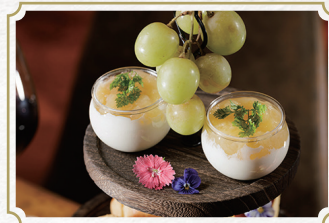
旬の県産フルーツを使った 夜のアフタヌーンティー