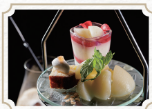
桃とマスカットの プチアフタヌーンティー