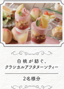
白桃が紡ぐ、 クラシカルアフタヌーンティー 2名様分