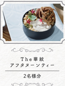
The 華紋 アフタヌーンティー 2名様分