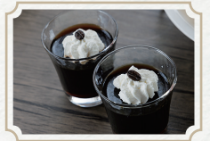
ミニkobacoffee アフタヌーンティー