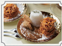
レトロポップな アフタヌーンティー 2名様分