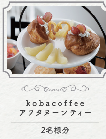
kobacoffee アフタヌーンティー 2名様分