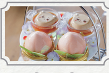
桃と紅茶の アフタヌーンティー