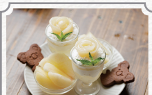
発酵と米粉の アフタヌーンティー 2名様分