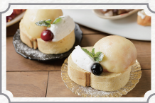
Sumica.の米粉と桃の アフタヌーンティー夏