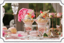
ピーチプリンセス アフタヌーンティー