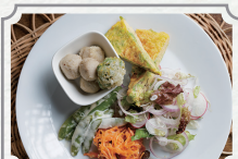
築160年古民家の 夏の爽やかアフタヌーンティー