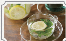
夏を乗り切る、 潤いアフタヌーンティー ~ビタミン&ミネラル強化編~ 2名様分