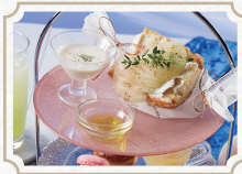
白桃の プチアフタヌーンティー

📍 倉敷市本町17-1 🅇 あり(倉敷市民会館駐車場30分無料) 📅 不定休 🕒 平日 11:00~16:00(16:00) 土日祝 10:00~16:00(16:00) 👤 1名様から 🚫 不可 🍴 10食 📞 予約不可 💰 2,500円