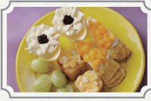
POP FLOWER afternoon tea