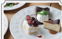
ミルク라운の アフタヌーンティー 2名様分