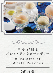
白桃が彩る パレットアフタヌーンティー A Palette of White Peaches 2名様分