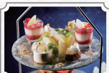
白桃とマスカットの 贅沢アフタヌーンティー