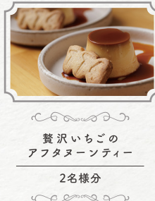
贅沢いちごの アフタヌーンティー