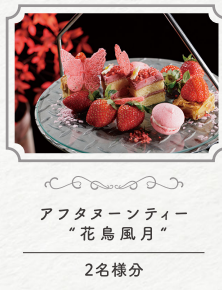
アフタヌーンティー “花鳥風月”