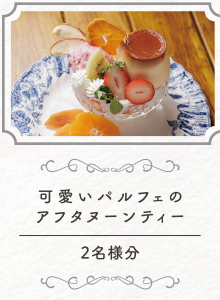
可愛いパルフェの アフタヌーンティ