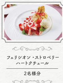
フェリシオン・ストロベリー ハートクチュール