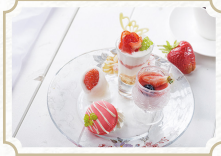
いちごの プチアフタヌーンティー 1名様分