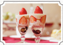
ストロベリー アフタヌーンティー 2026