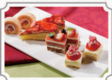
キャンドル卓 渡邊邸の アフタヌーンティーランチ