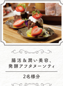
腸活 & 潤い美容、 発酵アフタヌーンティ