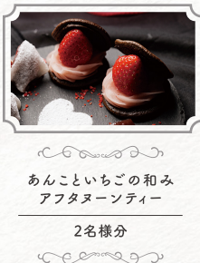
あんこいちごの和み アフタヌーンティー