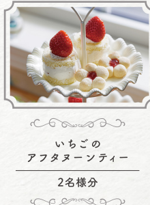
いちごの アフタヌーンティ