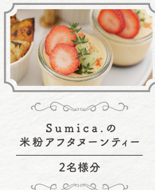
Sumica.の 米粉アフタヌーンティー