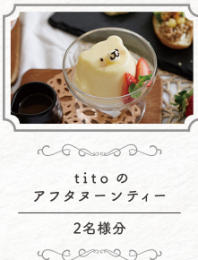
tito の アフタヌーンティー