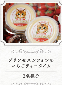
プリンセスシフォンの いちごティータイム