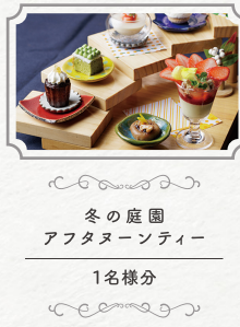
冬の庭園 アフタヌーンティ