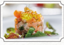
The 華紋 アフタヌーンティー