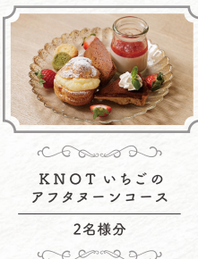
KNOT いちごの アフタヌーンコース