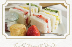
英国式 アフタヌーンティー 1名様分