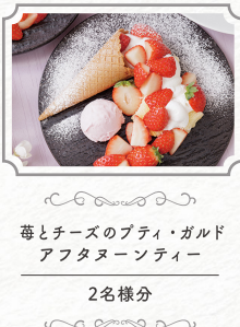
苺とチーズのブティ・ガルド アフタヌーンティ