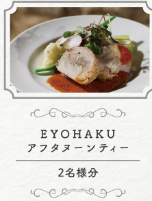
EYOHAKU アフタヌーンティー