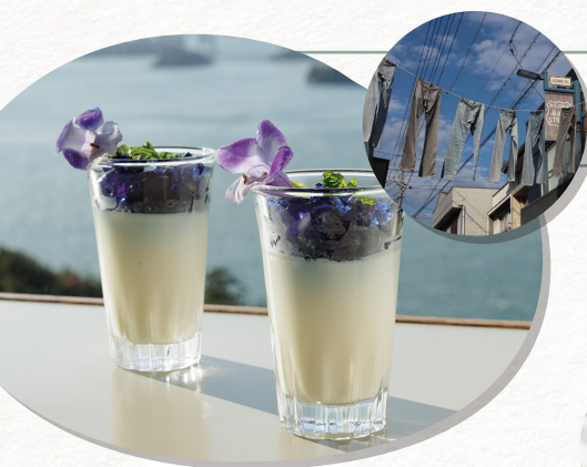
バタフライピーとパンナコッタの グラスデザート

児島ジーンズストリートをイメージした 青いゼリーとなめらかなパンナコッタのデザート。