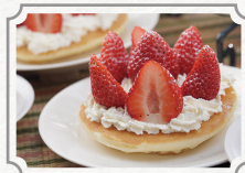
koba アフタヌーンティー