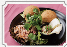
八間蔵アフタヌーンティー ～冬～