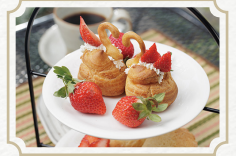
ミニkoba アフタヌーンティー 2名様分