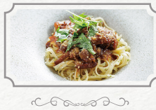
アイビー アフタヌーンティー