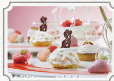
恋する乙女といちご アフタヌーンティー