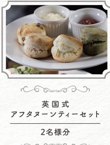
英国式 アフタヌーンティーセット